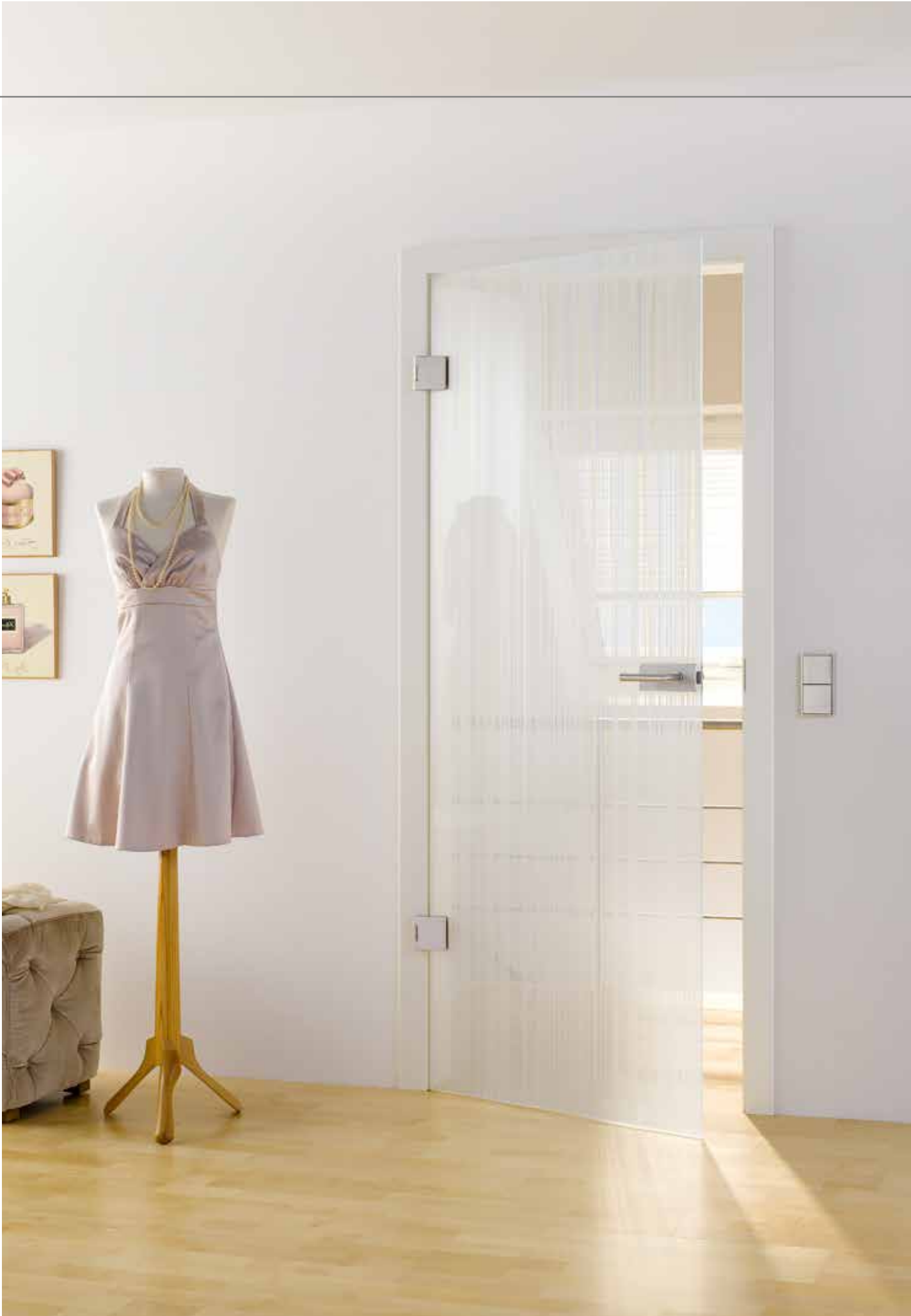
Drehtür 1-fig. | Glasdesign: Lista Due, Motiv beidseitig satiniert, 3D-Optik | Beschlagset: Square, ähnl. Edelstahl matt