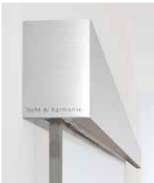
F1 Aluminium, ähnl. Edelstahl matt