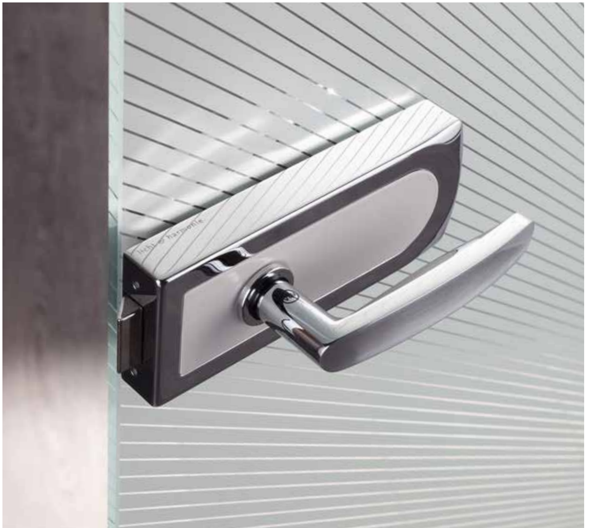
Beschlagset: Vista Due, ähnl. Chrom Glanz mit Inlay Weiß RAL 9010 | Drücker: H1043 Chrom/Chrom satiniert