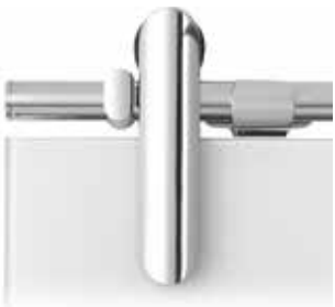
Edelstahl Chrom Glanz poliert, Edelstahl matt