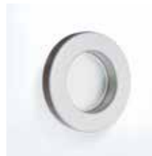
L&H Griffmuschel M 70 F1 Aluminium, ähnl. Edelstahl matt, 70 mm Durchmesser