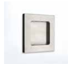
L&H Griffmuschel M 60 ähnl. Edelstahl matt, F1 Aluminium, 64 x 64 mm