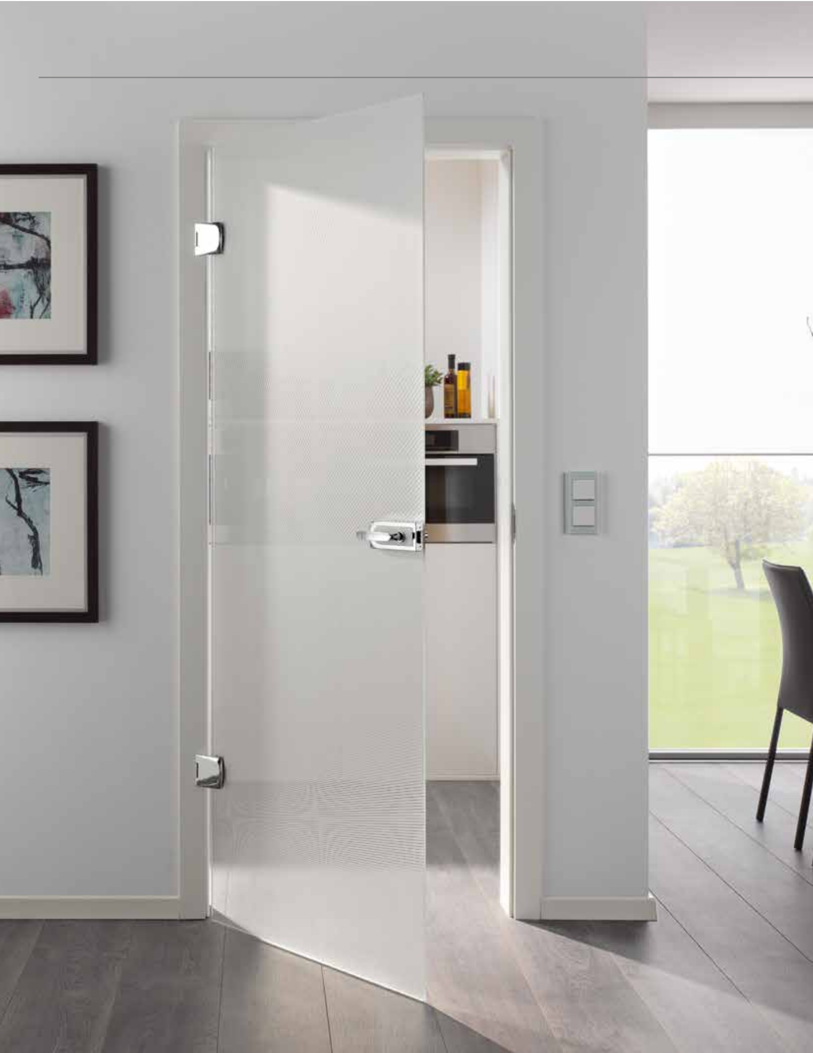
Drehtür 1-flg. | Glasdesign: Lucido | Beschlagset: Vista Due, ähnl. Chrom Glanz mit Inlay Weiß RAL 9010