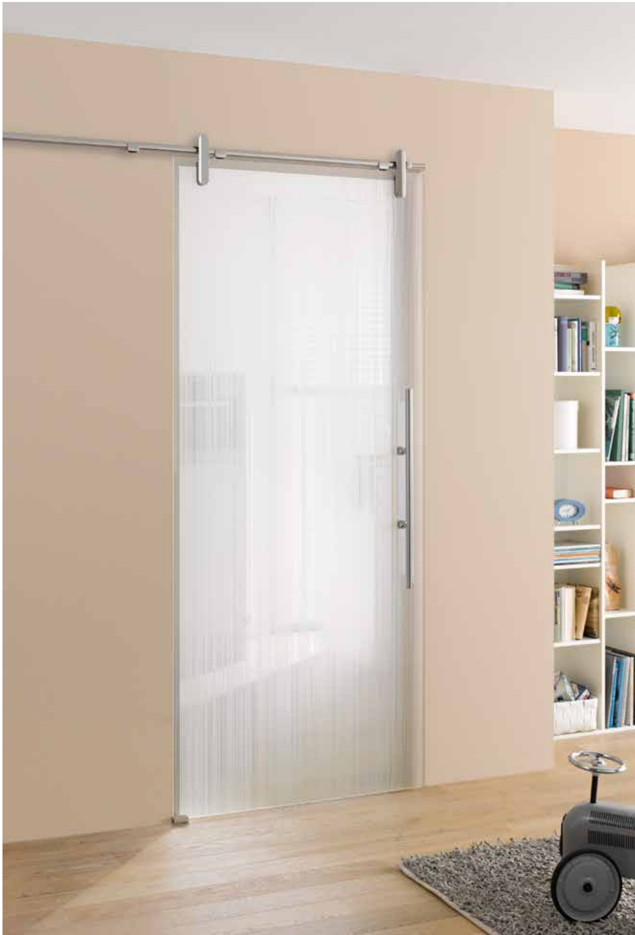
Schiebesystem: Edition Style, Edelstahl Chrom Glanz poliert | Glasdesign: Lista Due, Motiv beidseitig satiniert, 3D-Optik Griffstange: L&H G 700, Edelstahl Chrom Glanz poliert, Griffleiste einseitig