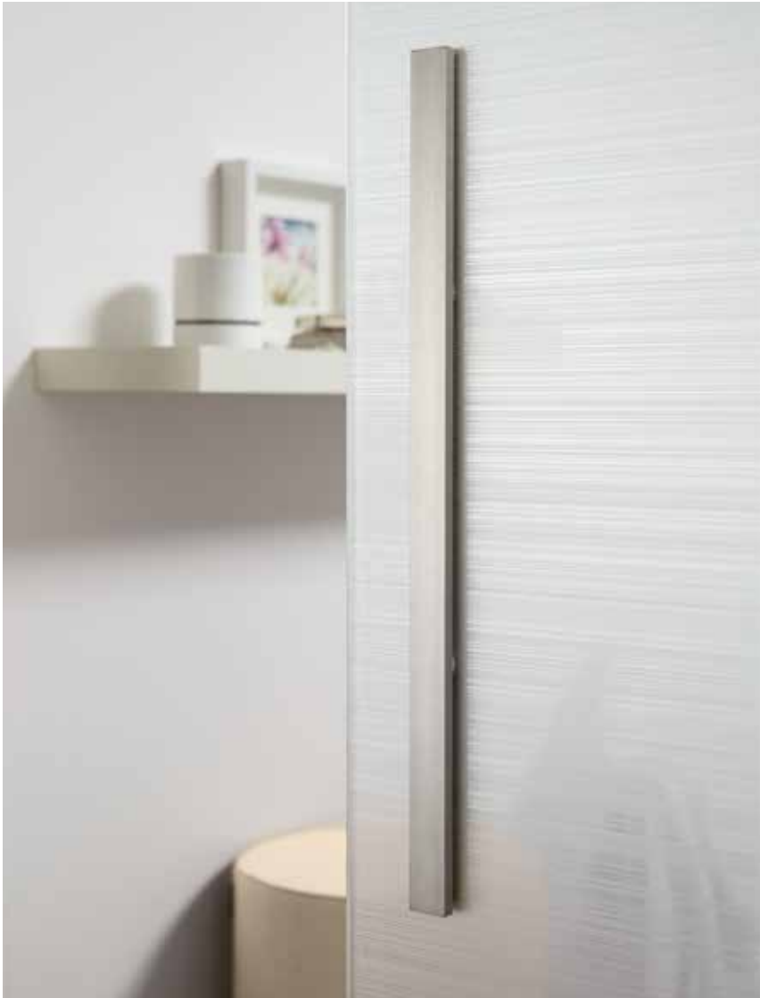
Glasdesign: Corteo | L&H Griffleiste beidseitig, 600 mm, ähnl. Edelstahl matt