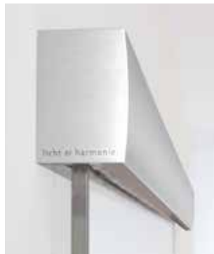
F1 Aluminium, ähnl. Edelstahl matt