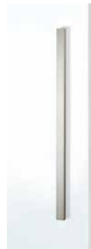
L&H Griffleiste beidseitig ähnl. Edelstahl matt, F1 Aluminium, Längen: 370, 600 mm

Mit der einseitig oder beidseitig montierten schmalen L&H Griffleiste lässt sich das Schiebetürblatt komplett über die gesamte Durchgangsbreite öffnen.