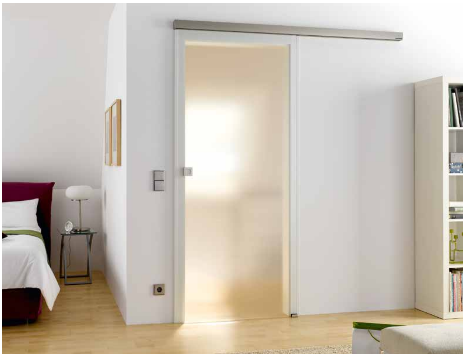
Schiebesystem: Tvin 2.0, ähnl. Edelstahl matt, Vor-Zargen-Montage mit Hinterfütterungsprofil Glasdesign: Modena | Griffmuschel: L&H M 60, ähnl. Edelstahl matt

Dieses Glasmotiv besticht durch seine filigrane Optik und anspruchsvolle Fertigung. Unterstreichen Sie mit Modena Ihren gehobenen Anspruch und bekennen Sie sich zum klassischen Wohnen, das ganz dem Zeitgeist entspricht.