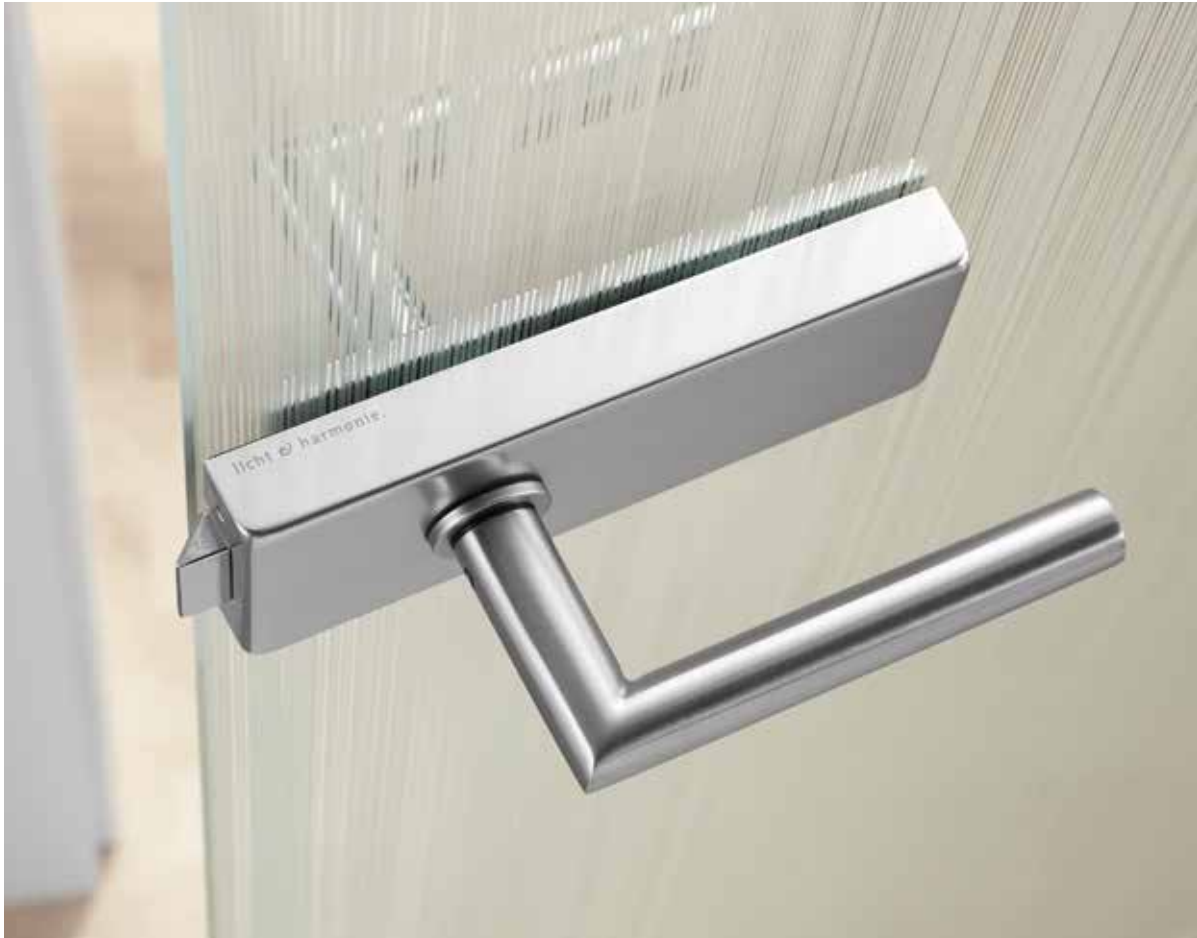
Beschlagset: Square, ähnl. Edelstahl matt | Drücker: L-Form, Edelstahl matt