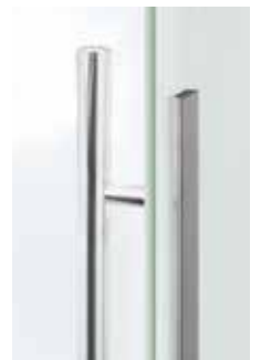
L&H Griffstange rund mit Griffleiste einseitig Edelstahl Chrom Glanz poliert, Edelstahl matt, F1 Aluminium, Längen: 420, 700 mm

Mit der einseitig oder beidseitig montierten schmalen L&H Griffleiste lässt sich das Schiebetürblatt komplett über die gesamte Durchgangsbreite öffnen.