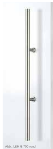
L&H Griffstange rund Edelstahl Chrom Glanz poliert, Edelstahl matt, F1 Aluminium, Längen: 420, 700 mm